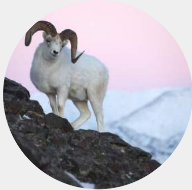
MOUFLON DE DALL - KLUANE NATIONAL PARK