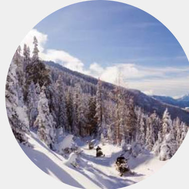
MOTONEIGE - WHISTLER