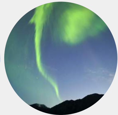
AUROS BOREALES YUKON

Les Canadiens savent tirer le meilleur parti de l'hiver. Peu importe où et quelles que soient les conditions, ils n'hésitent pas à sortir et à profiter de la neige fraîche, de la nature sauvage et du magnifique paysage qui les entoure.