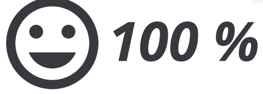
Temps forts du bilan selon nos clients