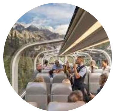
À BORD DU TRAIN

C'est grâce à l'arrivée du train, il y a plus de 150 ans , que le tourisme a commencé dans l' Ouest canadien .