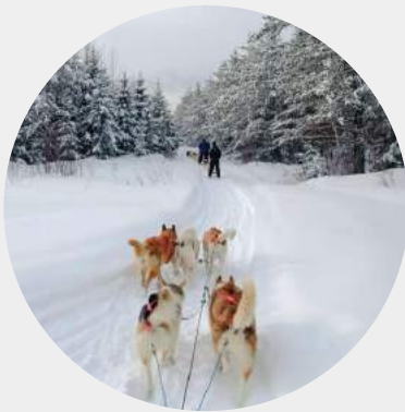
CHIEN DE TRAINEAU