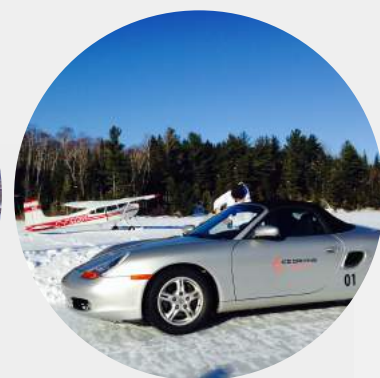
AVION SUR SKI

Venez vivre l'expérience d'un véritable hiver enneigé au cœur du Québec.