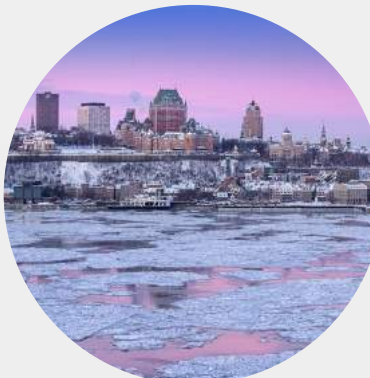
VILLE DE QUÉBEC